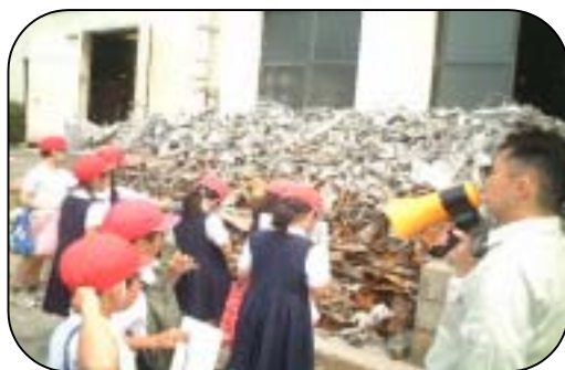
4年生清掃工場(中工場)の見学 5/21

また、花が小さいからと言って、その花の小さなことを恥ずかしいと思ってはならない。大の花は、大の花なりに、小の花は小の花なりに、力の限り、懸命に咲くのが美しいのだ」と言うことなのです。子どもたちの性格や個性、考え方などは、それぞれ違いがあって当然なのです。一人一人の子どもたちが互いの違いを認め合って共生し、一生懸命に、たくましく成長し、「心豊かに生きる力」を身につけていってほしいと願っております。