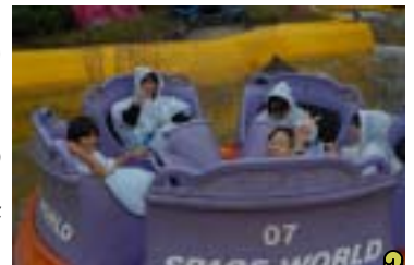
班で行動したスペースワールド

10月23日(月)山口県秋芳洞、秋吉台、下関海響館、24日(火)いのちのたび博物館、スペースワールドに行きました。文化や大自然の偉大さ神秘さに触れ、友情を深めることができました。班での行動もみごとに連携し合っ、ルールを守ってのさわやかなよい修学旅行となりました。