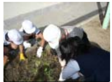
地域の方といもほり

開かれた学校づくりをめざして今年度も「学校へ行こう」週間を計画いたしました。「学校のよさにふれる一週間」として、学校の様子を見ていただき、学校と家庭、地域が一体となって子どもの成長にかかわっていききっかけにしていきたいと考えております。保護者の皆様、地域の皆様ぜひご来校ください。