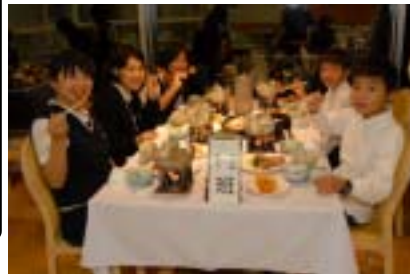
友だちと過ごしたマリンテラスあしや