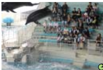
イルカショーに歓声をあげた下関海響館