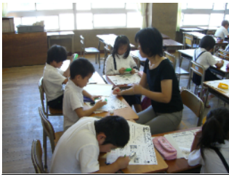
夏休みサマーチャレンジ

パソコン教室のパソコンも20台増設され、倍の40台になりました。1人が1台を使うことができるようになりました。