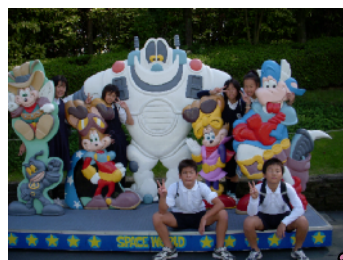
スペースワールド